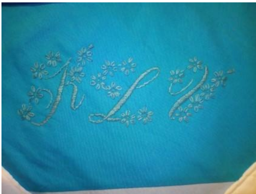
Joonis 5. Tikitud monogrammide.

Oma töö isikupärastamiseks otsustasin töö käigus, et tikin teki nurka monogrammide ehk oma nime algustähed. Tikkimiseks leidsin idee ajakirjast „Minu käsitööd“ 2015. aasta oktoobri numbrist. Kõigepealt suurendasin ajakirjas olnud monogrammide minule sobivaks suuruseks ja kujundasi ka natuke ümber. Tikkimiseks kasutasin sinist mulineed. Tähed tikkisin mähkpistes ja sirged jooned varspistes ja lillede tikkimiseks kasutasin ahelpistet. ( vt Joonis 5)