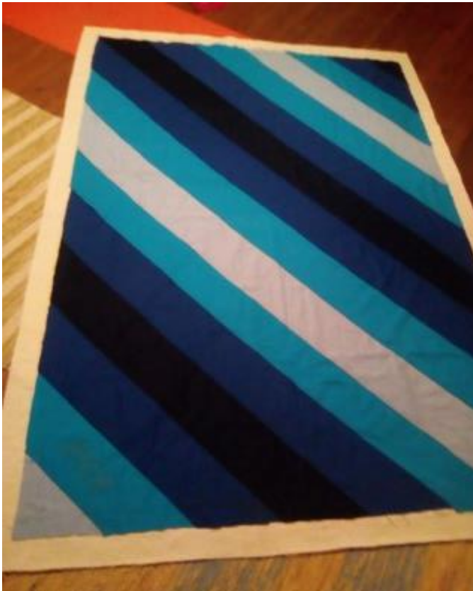
Joonis 6. Aluskangale asetatud lapitekk.