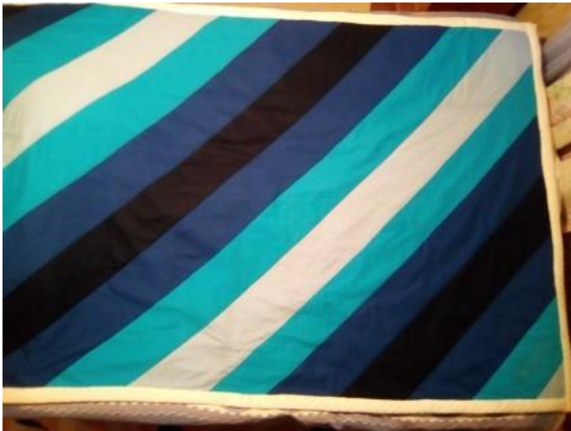
Joonis 8. Valmis voodikate.

Viimase tööna oli teki teppimine. See on vajalik selleks, et kihid koos püsiksid. Teppisin käsitsi pistetega diagonaalõmbluste vahekohtadest ja nii minu voodikate valmis saigi mõõtudes 2 m x 1,2 m (vt Joonis 8).