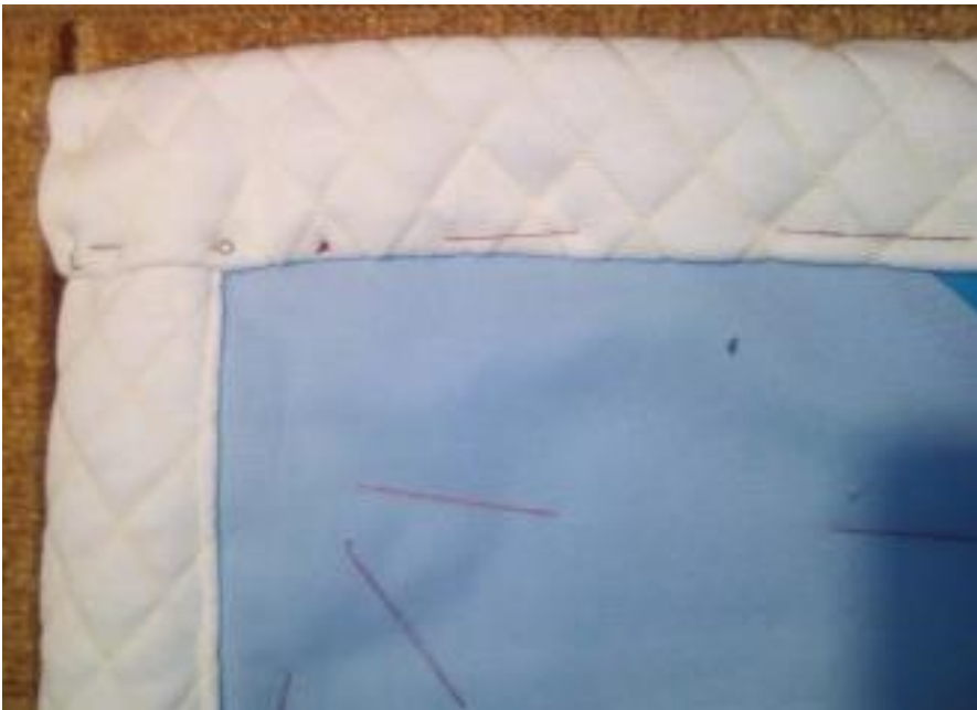
Joonis 7. Aluskangaga kantimine.