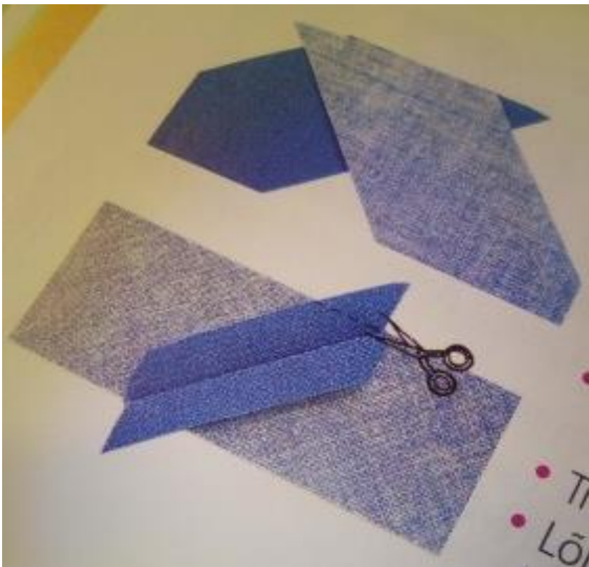
Joonis 4. Diagonaalribade ühendamine. (Pink, 2003)

Pikemate diagonaalribade saamiseks, tuli lühemad ribad omavahel kokku õmmelda. Selleks tuli kasutada diagonaalribade jätkamise tehnikat. Diagonaalribad pidi panema paremate pooltega vastamisi, et nurgad jääksid üksteisest üle, et kahest osast moodustuks sirge serv. (vt Joonis 4)