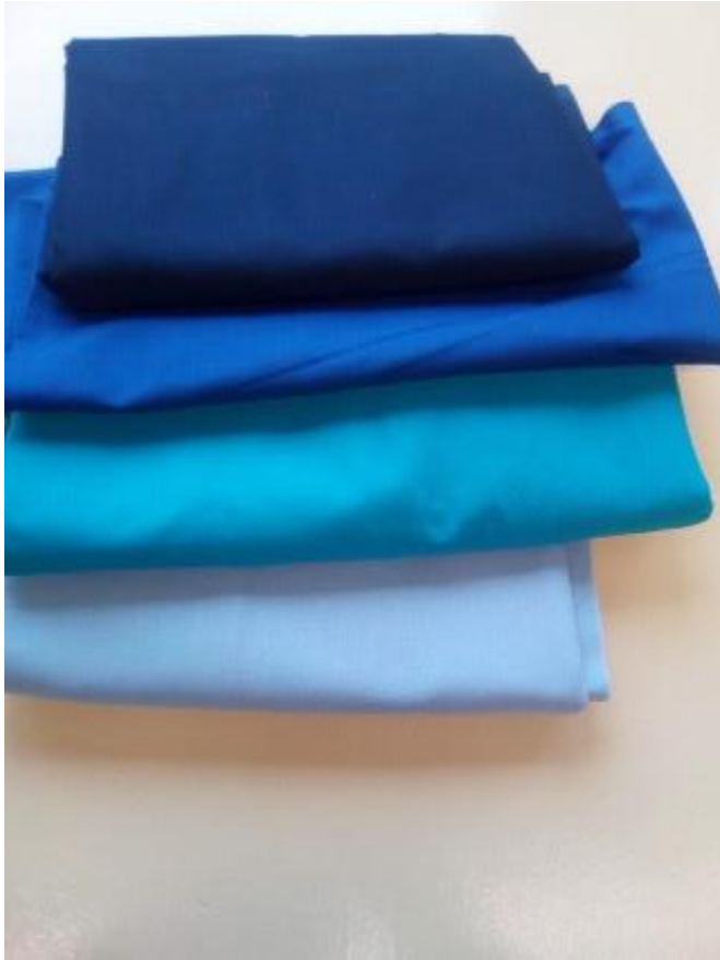
Joonis 2. Kangad.