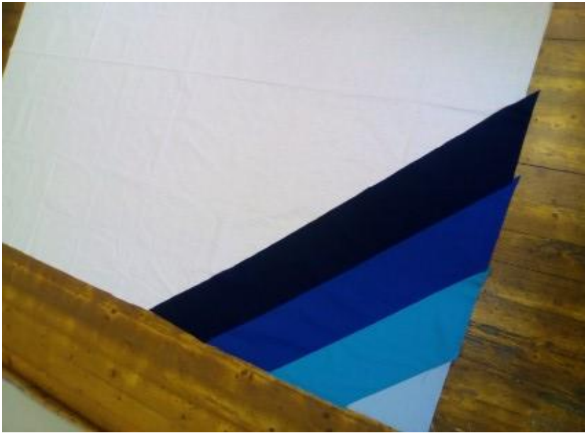
Joonis 3. Diagonaalribade õmblemine valgele aluskangale.

Pikemate diagonaalribade saamiseks, tuli lühemad ribad omavahel kokku õmmelda. Selleks tuli kasutada diagonaalribade jätkamise tehnikat. Diagonaalribad pidi panema paremate pooltega vastamisi, et nurgad jääksid üksteisest üle, et kahest osast moodustuks sirge serv. (vt Joonis 4)