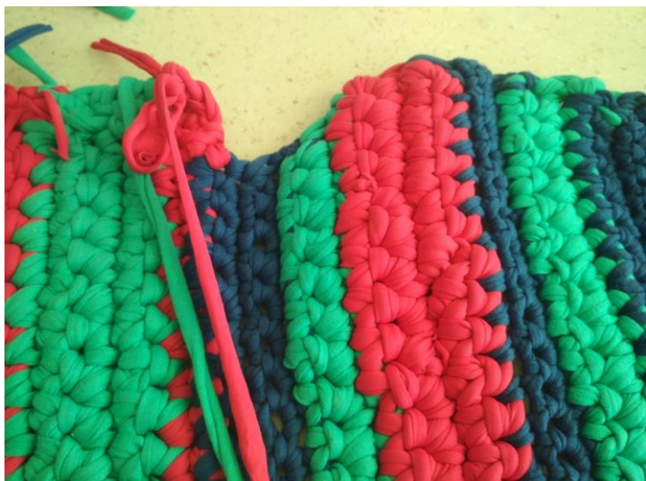
Joonis 4. Ebaühtlased ääred

korrigeerimine vaiba heegeldamise juures kõige tüütum töö. Sealjuures tekkis palju lõngaotsi ja kõik otsad oli vaja ühekaupa peita ning kinni nõeluda, et vaipa raputades/kloppides otsad lahti ei läheks. Pärast seda ma pressisin vaiba korralikult läbi ja vaip saigi valmis (vt Joonis 5).