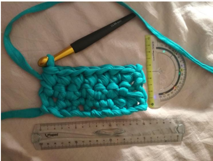
Joonis 3. Proovitöö

Kuna plaanisin teha vaiba umbes 160 cm pika ja 75 cm laia, siis oli vaja teha proovitöö (vt Joonis 3), et arvutada vajalik silmuste arv. Proovitöö tegin 10 silmaga ja töö laiuseks sain 15,5 cm. Seega oli mul vaja alustuseks teha 48 ahelsilmust.