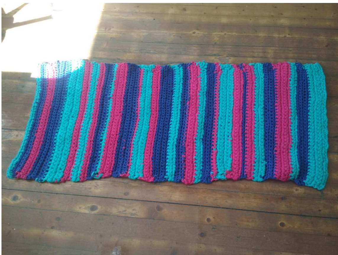
Joonis 5. Valmis vaip (autori erakogu)