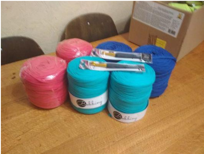
Joonis 1. Vaibalõngad

Kõigepealt oli vaja valida värvid ja lõngad. Esialgu mul kavandit polnud, mõtlesin lihtsalt oma peas, mis värvid mulle meeldiksid ja kas need ka vaibas kokku sobiksid. Mul oli välja mõeldud mitu erinevat värvikombinatsiooni. Otsustasin türkiissinise, fuksiaroosa ja tumesinise kasuks. Siis oli vaja saada lõngad. Kuna oli karantiiniaeg, siis tellisime emaga lõngad e-poest pildi ja kirjelduse järgi. Ja hiljem selguski, et lõngad (vt Joonis 1) olid erineva jämedusega ja tegid vaiba heegeldamise keeruliseks.