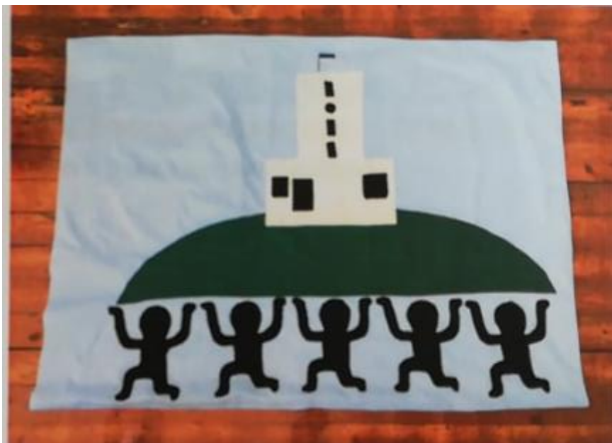
Joonis 4. Lipu esikülg

Lähtuvalt aplitseerimise teooriast asusin lipule detaile peale panema. Kinnitasin aplikatsioonid nõõpnõeltega, nii et need õmblemise ajal paigast ei liiguks ja õmblesin masinaga alguses tavalise pistega ja hiljem siksakpistega üle. Kuna torni aknad ja uks olid väga väikesed detailid, siis need kinnitasin tornile käsitsi sämppistega. Pärast seda õmblesin torni tippu lipu ja lipu varre tikkisin varspistes. Nii sai valmis lipu esikülg (vt Joonis 4).