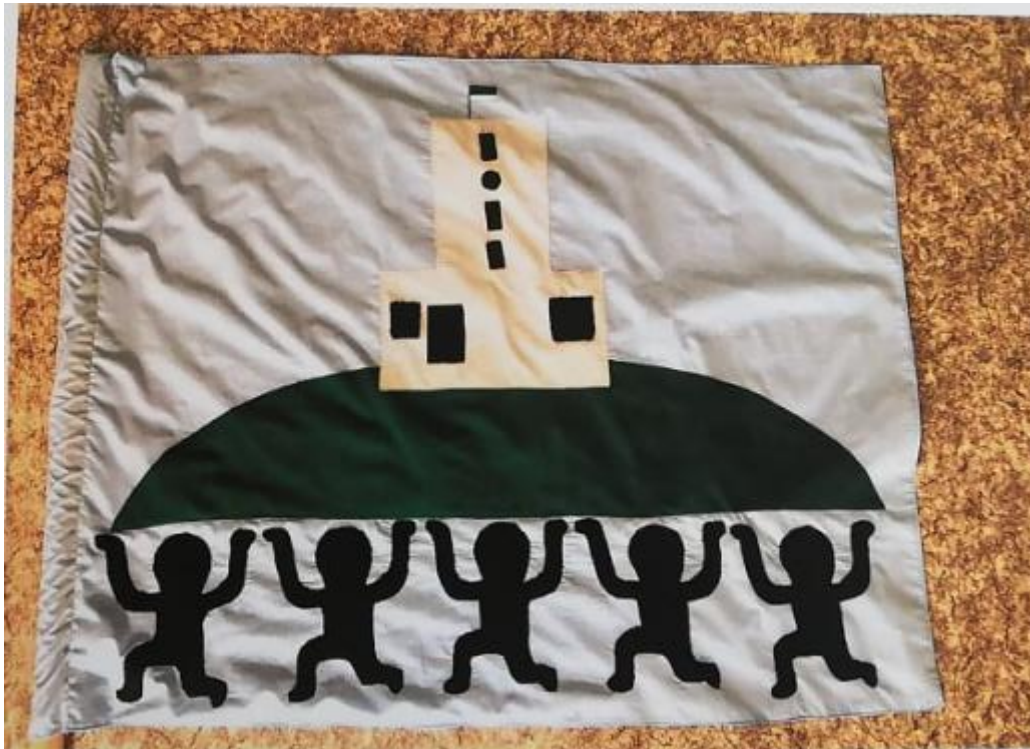
Joonis 5. Valmis lipp (autori erakogu)

Lipu valmis õblemise järgmine ülesanne oli esikülje kokku õblemine tagaküljega. Kõigepealt lõikasin esiküljega sama suure kanga lipu tagaküljeks ja seejärel õmblesin selle esiküljega kokku. Selleks et kaks kangast koos püsiks, oli vaja teha õmblus läbi kahe kanga. Otsustasin mõlemad kangad läbi õmmelda mäe alumist joont mööda. Viimaseks lipu valmistamise etapiks oli lipuvardale tunneli tegemine. Seal traageldasin ka kaks poolt kokku ja õmblesin masinaga üle. Lõpuks pressisin kõik veel korralikult läbi, lisasin lipuvarda ja Haanja rühma lipp saigi valmis (vt Joonis 5).