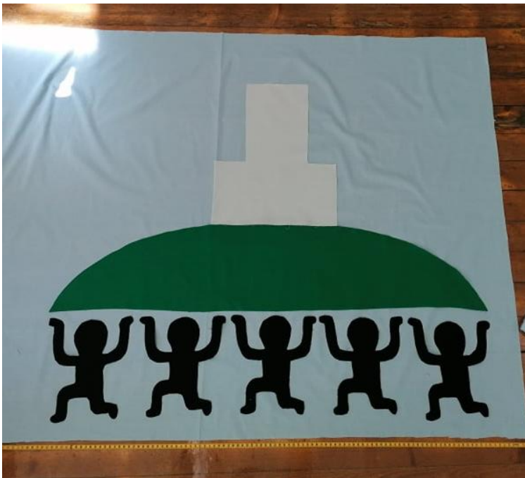
Joonis 3. Kangast välja lõigatud detailid

Järgmiseks ostsin vastavalt kavandis mõeldud värvidele kangad. Lõikasin kangast šabloonide järgi detailid (vt Joonis 3).