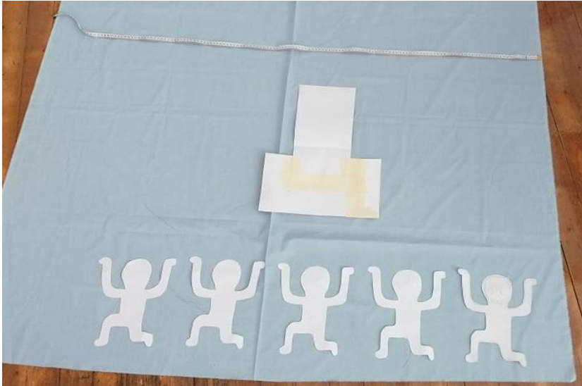
Joonis 2. Šabloonid

Järgmiseks ostsin vastavalt kavandis mõeldud värvidele kangad. Lõikasin kangast šabloonide järgi detailid (vt Joonis 3).